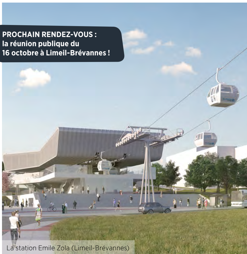
La station Emile Zola (Limeil-Brévannes)

PROCHAIN RENDEZ-VOUS : la réunion publique du 16 octobre à Limeil-Brévannes !