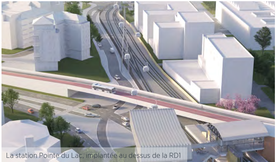
La station Pointe du Lac, implantée au dessus de la RD1

À Créteil, pour la station Pointe du Lac, deux variantes étaient proposées : la première prévoyait une intégration de la station au dessus des voies de la ligne 8 du métro ; la seconde d'installer la station au dessus de la RD1. C'est la variante n° 2 qui a été jugée la plus pertinente et qui sera présentée à l'enquête publique. Les études menées ont consisté à mesurer l'impact des différentes variantes – tant sur le plan technique et financier, que sur les infrastructures du réseau de transport actuel.