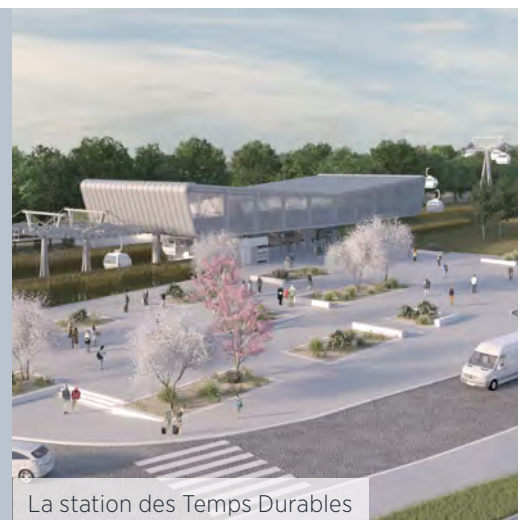
La station des Temps Durables